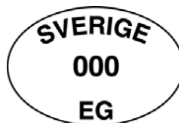
Kontrollmärke (minst 6,5 x 4,5 cm)

Slaktkroppar, parter av slaktkroppar och slaktbiprodukter som produceras vid slakteri eller vilthanteringsanläggning är undantagna från reglerna om identifieringsmärkning. I stället finns regler om att märkning ska ske där med ett så kallat kontrollmärke, som ett led i den offentliga kontrollen. Kontrollmärket är i regel ovalt. Avsikten med